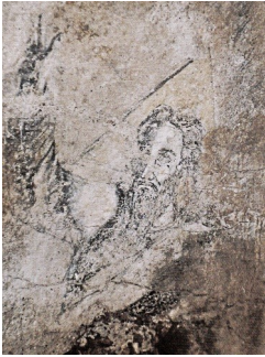
Fresque de Dieu le Père à la Darse